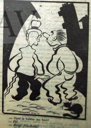
— Neredi ile buldun mu bari? — EN? — Hangi Fabrikası? — Barında kökükükü bariye görüyor...

Bekerköy Bez Fabrikasında bir kaza olmuştur. Karyanında olan bir otomobilin, fabrikaya girerken kaza yapılmıştır. Yaralıları hastahaneye kaldırılmıştır.